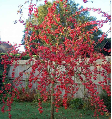
Jabloň (okrasná): Malus x robusta ‘Red Sentinel’