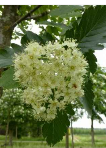
Jeřáb prostřední: Sorbus intermedia ‘Brouwers’