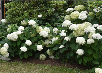
Hortenzie stromčekovitá: Hydrangea arborescens ‘Annabelle’