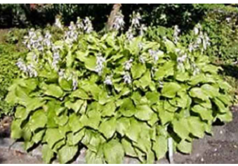
Bohyška jitrocelová: Hosta plantaginea