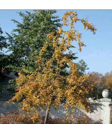
Jabloň (okrasná): Malus ‘Wintergold’