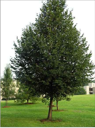
Lípa srdčitá: Tilia cordata ‘Rancho’