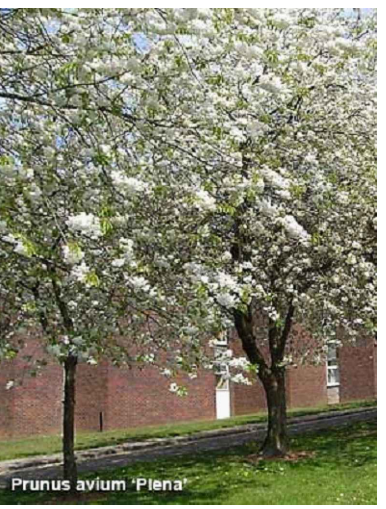
Třešeň ptačí: Prunus avium ‘Plena’