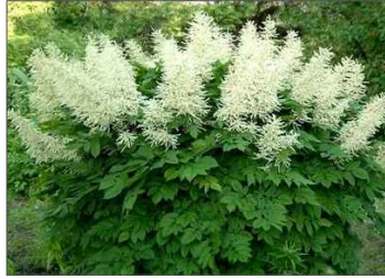
Udatna lesní: Aruncus dioicus