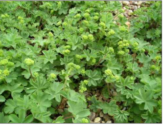
Kontryhel červenonohý: Alchemilla erythropoda