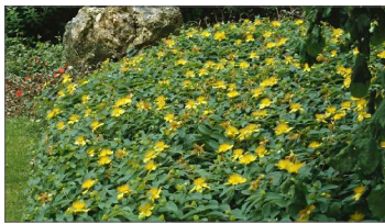
Třezalka kališkatá: Hypericum calycinum

stromořadí Tilia cordata ‘Rancho’ 15 ks, 1,5 m od chodníku, vzdálenost stromů 6 m od sebe, v podrostu živý plot z volně rostoucí netvarované meruzalky - ribes alpinum, výsadba meruzalky 1,3 m od chodníku, rostliny od stromů 1m, od sebe také 1 m, š. záhonu 0,5 m, šířka plotu v dospělosti 1,5 m VZHLEDEM KE ŠPATNÉMU STAVU SÍTĚ VO JE PLÁNOVÁNA JEJÍ OBNOVA, PŘI NÍ SE MŮŽE ZVĚTŠIT ODSUP OD STROMŮ