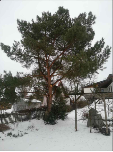
Borovice lesní: Pinus sylvestris