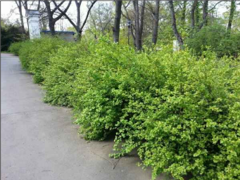
Meruzalka alpská: Ribes alpinum