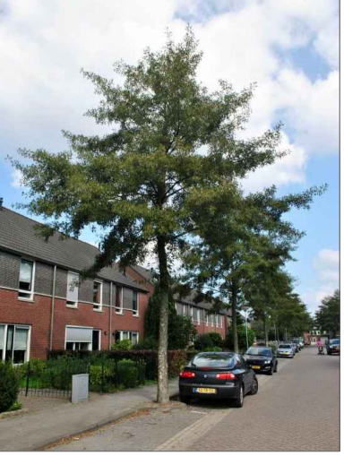
Olše šedá: Alnus incata ‘Laciniata’