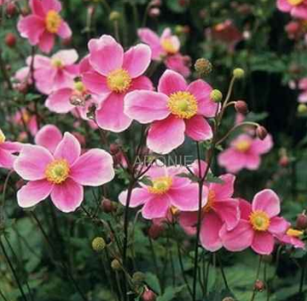
Sasanka japonská: Anemone hepatica