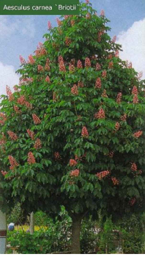
Jírovec pleťový: Aesculus x carnea ‘Briotii’