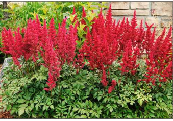
Čechrava Arendssova: Astilbe Arendsii